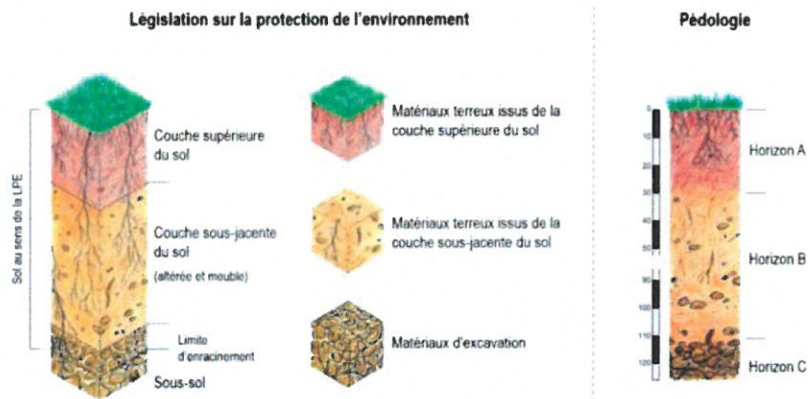
Figure 2 : Définitions du sol (source : Gestion respectueuse des sols lors de travaux de génie civil , OFEV 2022)