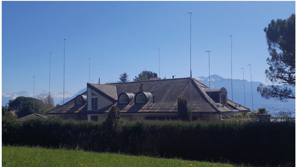
Bâtiment Senzi

C'est généralement à ce moment, en découvrant des gabarits nouvellement installés, que la population prend connaissance de l'existence d'un nouveau projet. Les plans détaillés et le dossier d'enquête peuvent être consultés sur notre site internet (rubrique Vivre à Paudex > Enquêtes en cours). Vous pouvez également venir consulter le dossier à l'administration communale.