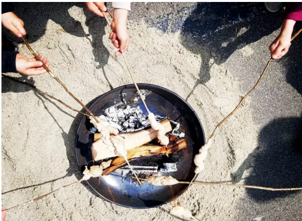
Fondation Homme et Nature