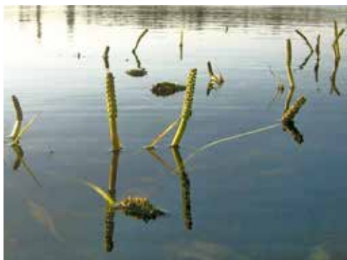
La floraison en surface du potamot.

La composition floristique de ces prairies sous-marines a beaucoup varié ces dernières