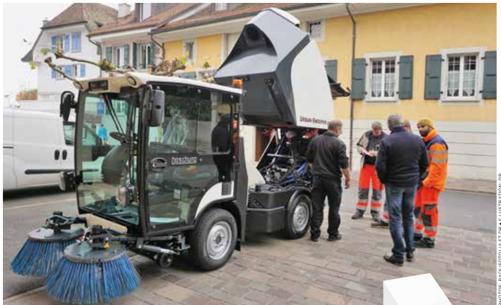
5 novembre 2018: livraison de la balayeuse!

Le modèle retenu à l'issue d'un appel d'offres sur invitation est l'Urban-Sweeper S2 du fabricant suisse Boschung SA, à Payerne. Les qualités techniques de ce véhicule, que ce soit son rayon de braquage, la puissance de son moteur ou ses différents accessoires, lui permettront d'accéder aussi bien au bord du lac que dans les hauteurs de la commune. Dès le mois de novembre, notre service de voirie disposera d'un outil efficace qui lui permettra d'assurer la propreté des rues, et ceci de façon autonome. L'élimination des mauvaises herbes sur les pavés et au bord des routes se fera à l'aide de brosses métalliques installées sur la balayeuse, ce qui permettra une réduction significative de l'utilisation d'herbicides. Un module de nettoyage à haute pression et un système d'arrosage embarqué rendront plus aisé le travail de nos collaborateurs. GF