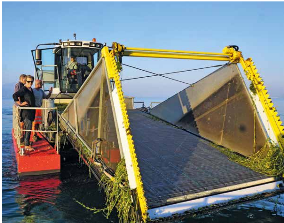
26 juillet 2018: la faucardeuse en action.

décennies. Le Potamogeton pectiné , qui résiste bien à la pollution, était dominant en 1997 (65% d'abondance relative), pour tomber à 11% actuellement. Le Potamogeton luisant , qui régressait, se développe bien. Bref, les prairies se portent de mieux en mieux, se diversifient et couvrent de plus importantes surfaces. Ce qui fait râler les nageurs, mais fait le bonheur de toute une faune qui profite de cette végétation.