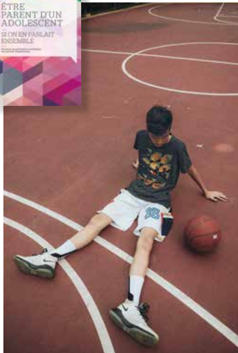
Adolescence: solitude et rêves au rendez-vous.

migrants accompagnés d'interprètes, ce qui a permis de moduler les textes selon les cultures de différentes communautés.