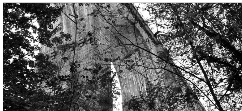
Le viaduc de Paudex a été inauguré en 1923.

Référence. Notice sur la reconstruction du viaduc de Paudex / E.Jambé / Bulletin technique de la Suisse Romande, 19256.