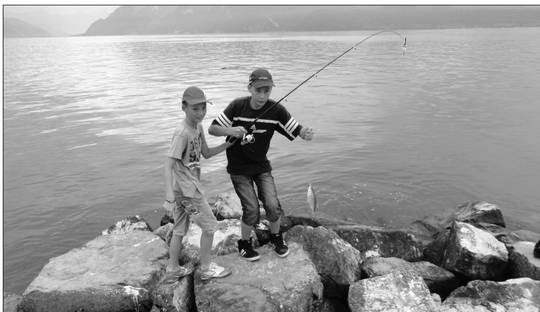
Découvrir le lac et la forêt au Passeport vacances.

Croisière 2013! Après une année de pause, c'est reparti pour la croisière lémanique. Elle aura lieu l'après-midi du 31 août 2013. Départ de Pully à 13h30, escale à Thonon, souper et retour sur Pully à 20h30.