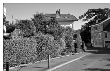
Tailler les haies: des règles à respecter.