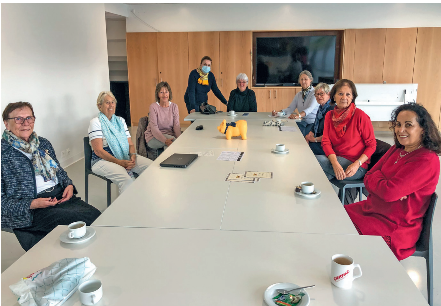
Le café du mercredi matin.

S i vous avez 55 ans et plus, n'hésitez pas à faire une pause-café ou thé avec les habitants de Paudex, le mercredi entre 9h30 et 11h30 à l'annexe polyvalente. C'est un moment solidaire, convivial, où chacune et chacun est le bienvenu. Si ce n'est pas votre tasse de thé, vous pouvez aussi rejoindre le groupe de pétanque mixte et pour amateurs, qui se retrouve deux jeudis par mois, de 15h à 16h, aux terrains de pétanque de la Campagne Marcel. Pour les passionnés de littérature, le groupe de lecture se réunit le premier mercredi du mois, de 14h à 15h, au chemin de la Verrière 8. C'est l'occasion de partager vos coups de cœur littéraires et de découvrir de nouvelles œuvres classiques ou récentes. Vous pouvez aussi retrouver le groupe de marche douce, deux jeudis par mois, de 9h30 à 11h30, devant la fontaine de Paudex, pour une petite promenade dans les environs. N'oublions pas non plus les préoccupations urbaines auxquelles les membres